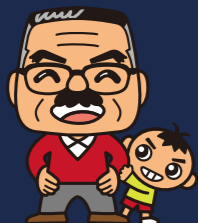
須山建設のイメージキャラクター 「がんこおやじ」