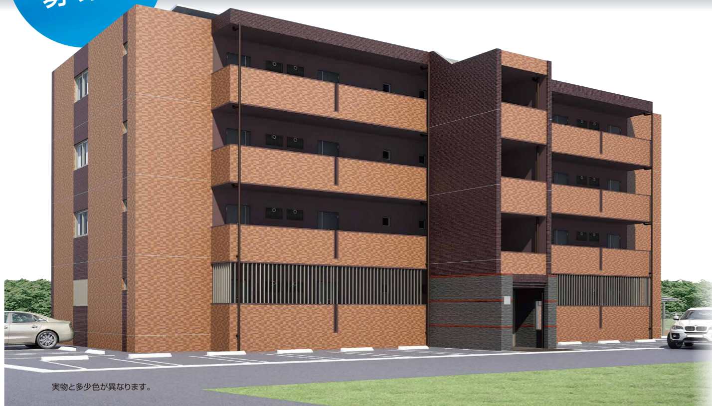
実物と多少色が異なります。