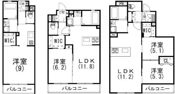
1Kタイプ 1LDKタイプ 2LDKタイプ