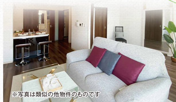
※写真は類似の他物件のものです