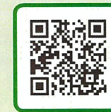
シニア賃貸の生活の1日